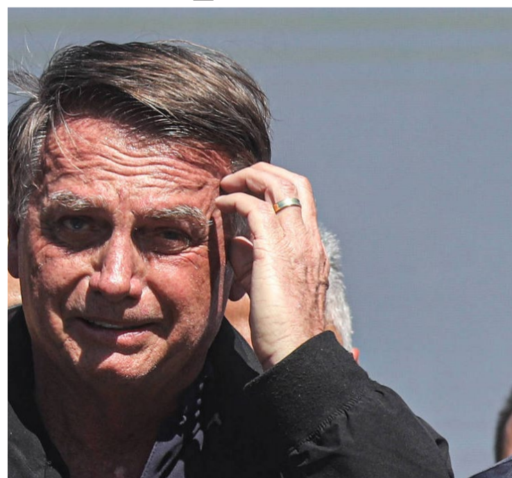
Jair Bolsonaro: PL não faz alianças eleitorais com os partidos de esquerda

Bolsonaro ainda alertou que ele deve apoiar candidaturas adversárias em municípios onde não for possível desfazer as coligações entre o PL e legendas de esquerda. “Já está definindo que nós estamos, além de desfazendo isso aí onde foi feito, você eleitor fica ligado, onde não for possível desfazer, nós vamos fazer campanha para o outro lado. Ver um bom candidato de outro partido e fazer campanha nesse sentido”, alertou.