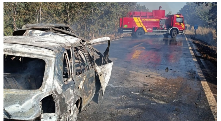
Acidente envolveu colisão entre dois veículos de passeio. Vítimas ocupantes de Hilux SW4 estavam conscientes

Na manhã deste domingo, 4 de agosto, Bombeiros Militares de Aruanã foram acionados para atender a um grave acidente de trânsito na GO-530, km 36, na Zona Rural, entre Aruanã e Araguapaz. O acidente envolveu a colisão entre dois veículos de passeio, resultando em um incêndio que consumiu ambos os carros. Ao chegarem ao local, os bombeiros encontraram duas vítimas, ocupantes de uma Hilux SW4, que estavam conscientes e apresentavam ferimentos leves. As vítimas, um homem de 80 anos e uma mulher de 52 anos, já haviam sido retiradas do veículo por terceiros e foram