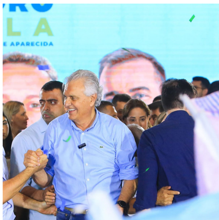
Americanos expressam preocupação com recentes acontecimentos: declaração conjunta com G7

A situação atual destaca a importância da cooperação internacional e do diálogo contínuo entre as nações. Os países do G7 continuam a defender a necessidade de soluções pacíficas e diplomáticas para os problemas globais. A comunidade internacional está sendo chamada a unir esforços para enfrentar os desafios e garantir um futuro mais seguro e estável para todos.