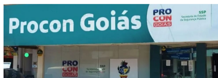
Mudança visa desburocratizar serviços e tornar acesso mais simples para a população