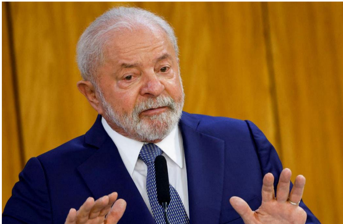
Lula da Silva: otimista com as pesquisas eleitorais em Goiânia e Campo Grande

O partido do presidente Lula está lançando candidatos em cinco das nove capitais da região, quatro deles com chances reais de chegar ao segundo turno. Teresina, Fortaleza, Natal e João Pessoa vão receber atenção especial da legenda, cidades onde os petistas aparecem bem colocados nas pes-